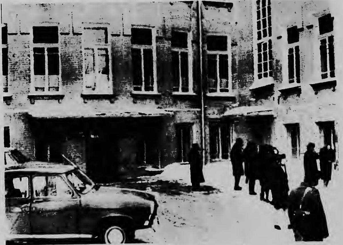
MOSCU--Riba e portret aki nos por mira e edificio di Corte, na unda Corte Suprema sovietica ta husgando e escritornan sovietico Aniel Sinyavsky y Yuli Daniel, pasobra nan a publica obranan anti-sovietico den extranhero.